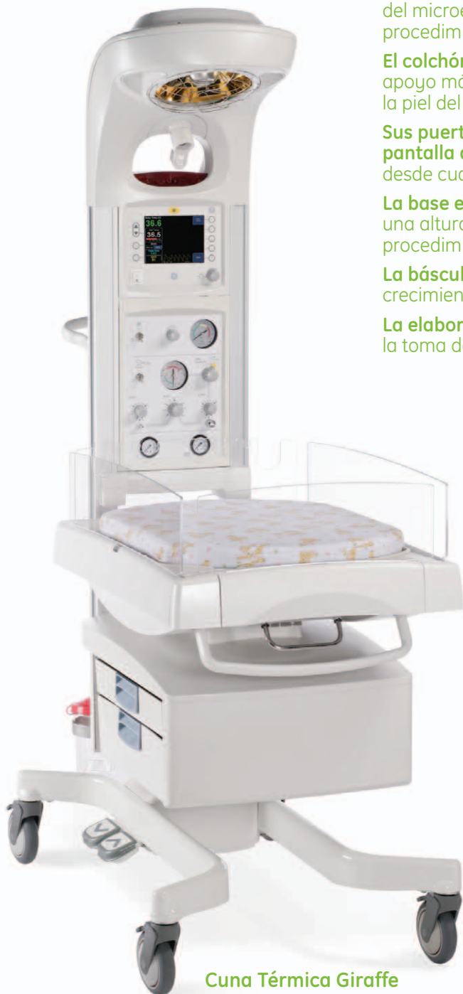
Cuna Térmica Giraffe