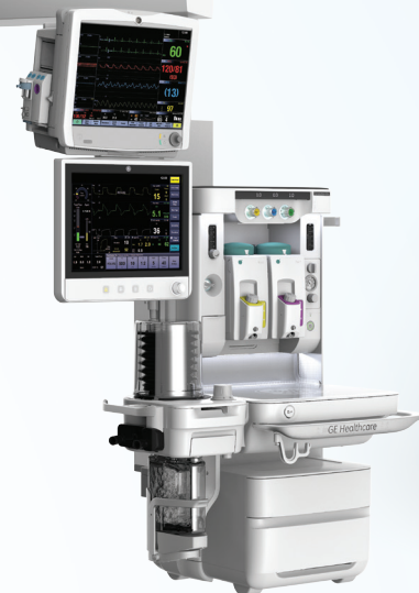
Opción de sistema colgante (Carestation 650c)