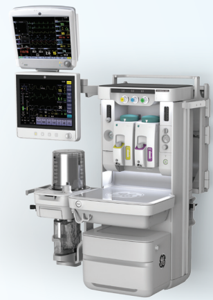
Opción de sistema de montaje en pared (Carestation 650c)