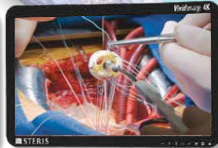
4 000 K Ra=95 / R9=97